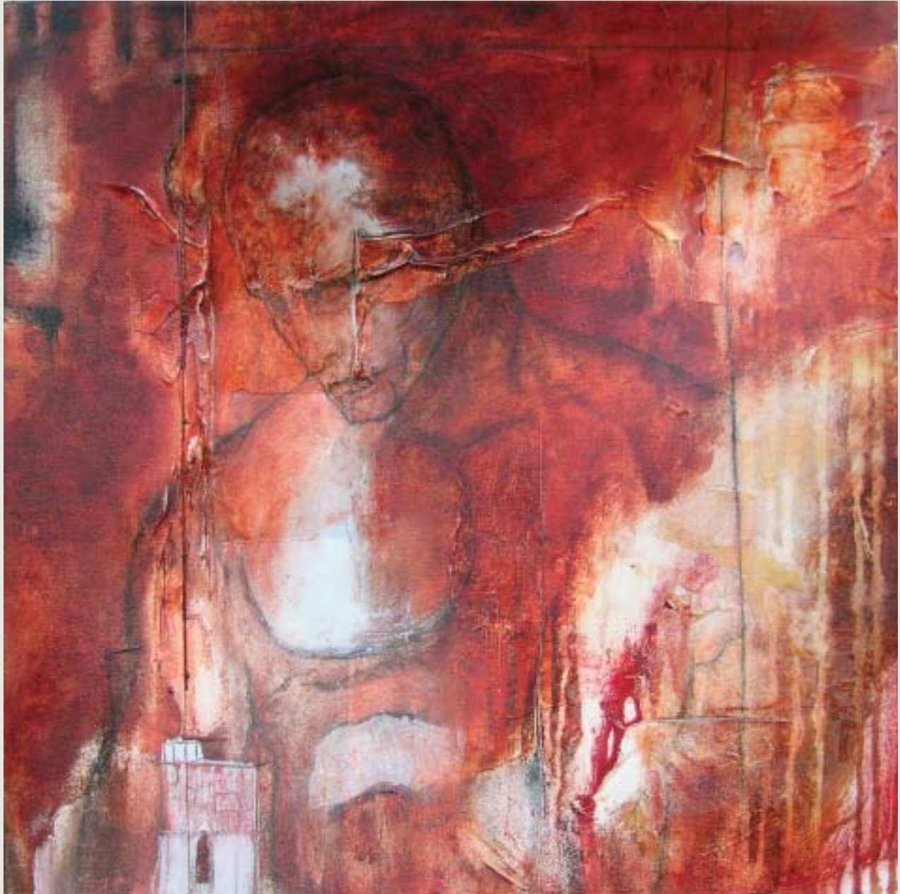
La chapelle bleue , 2003, techniques mixtes sur toile, 61 x 61 cm