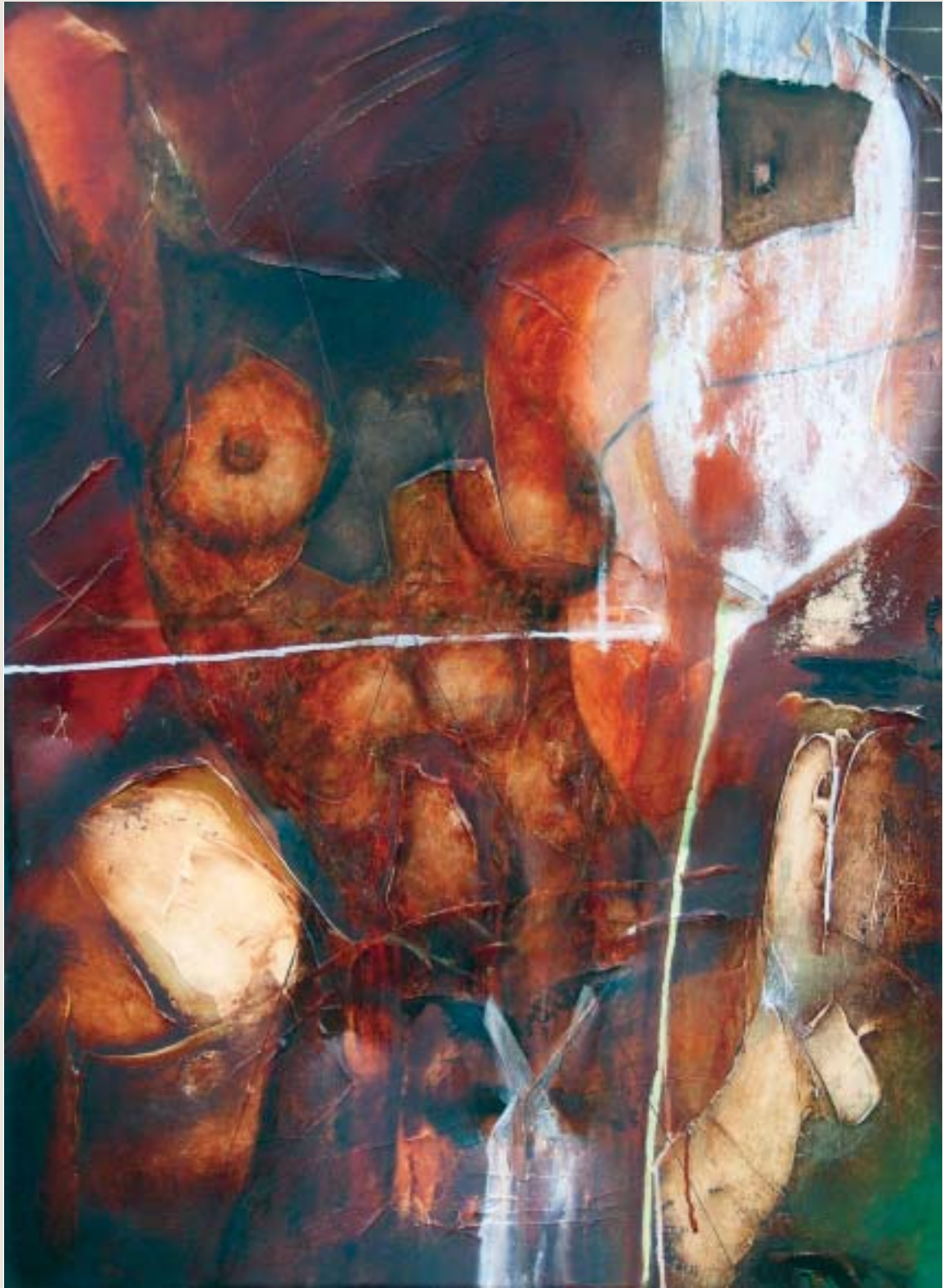
La croisée intime , 2003, techniques mixtes sur toile, 102 x 76 cm