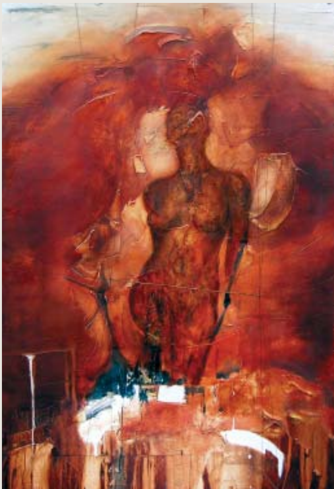
Paris-Abitibi , 2003, techniques mixtes sur toile, 153 x 102 cm