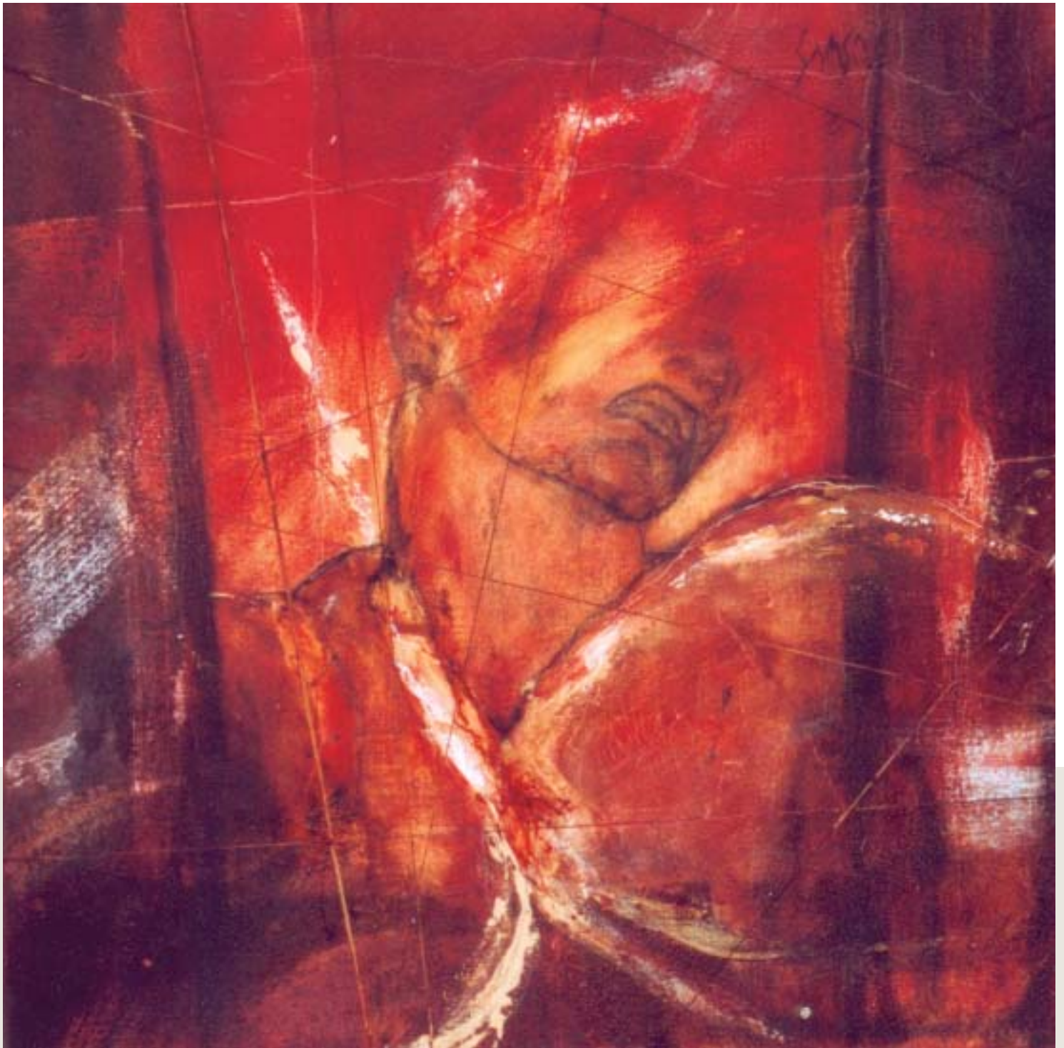
Sam , 2002, techniques mixtes sur toile, 51 x 51 cm