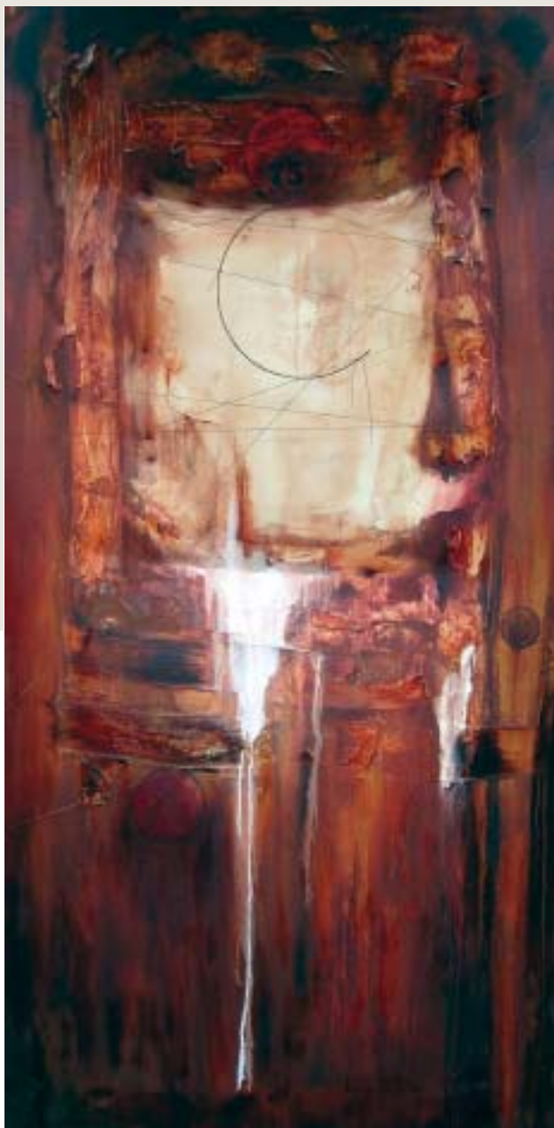
75 Fraser, 2003, techniques mixtes sur toile, 183 x 91 cm