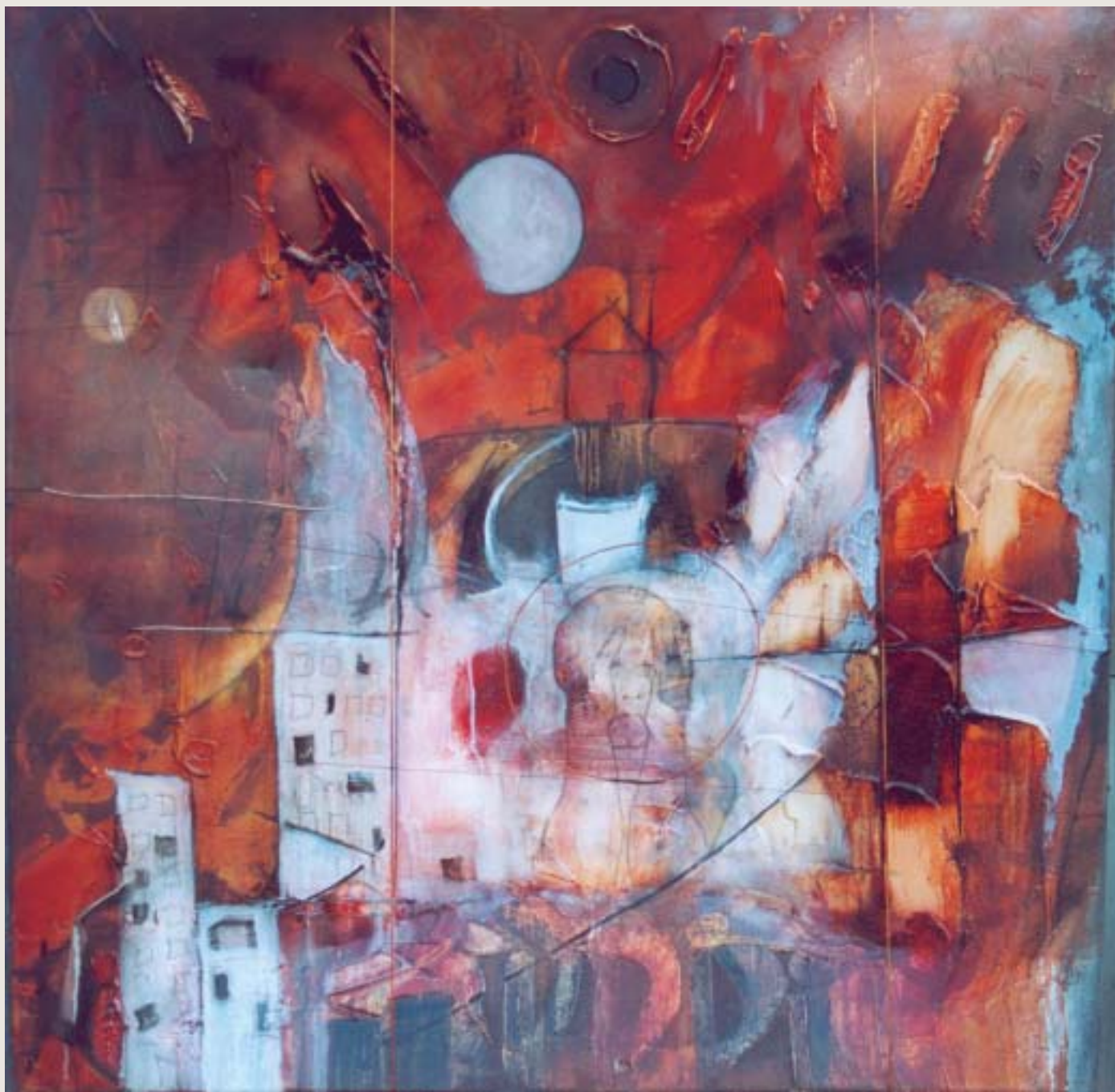
Les fenêtres noires , 2003, techniques mixtes sur toile, 122 x 122 cm