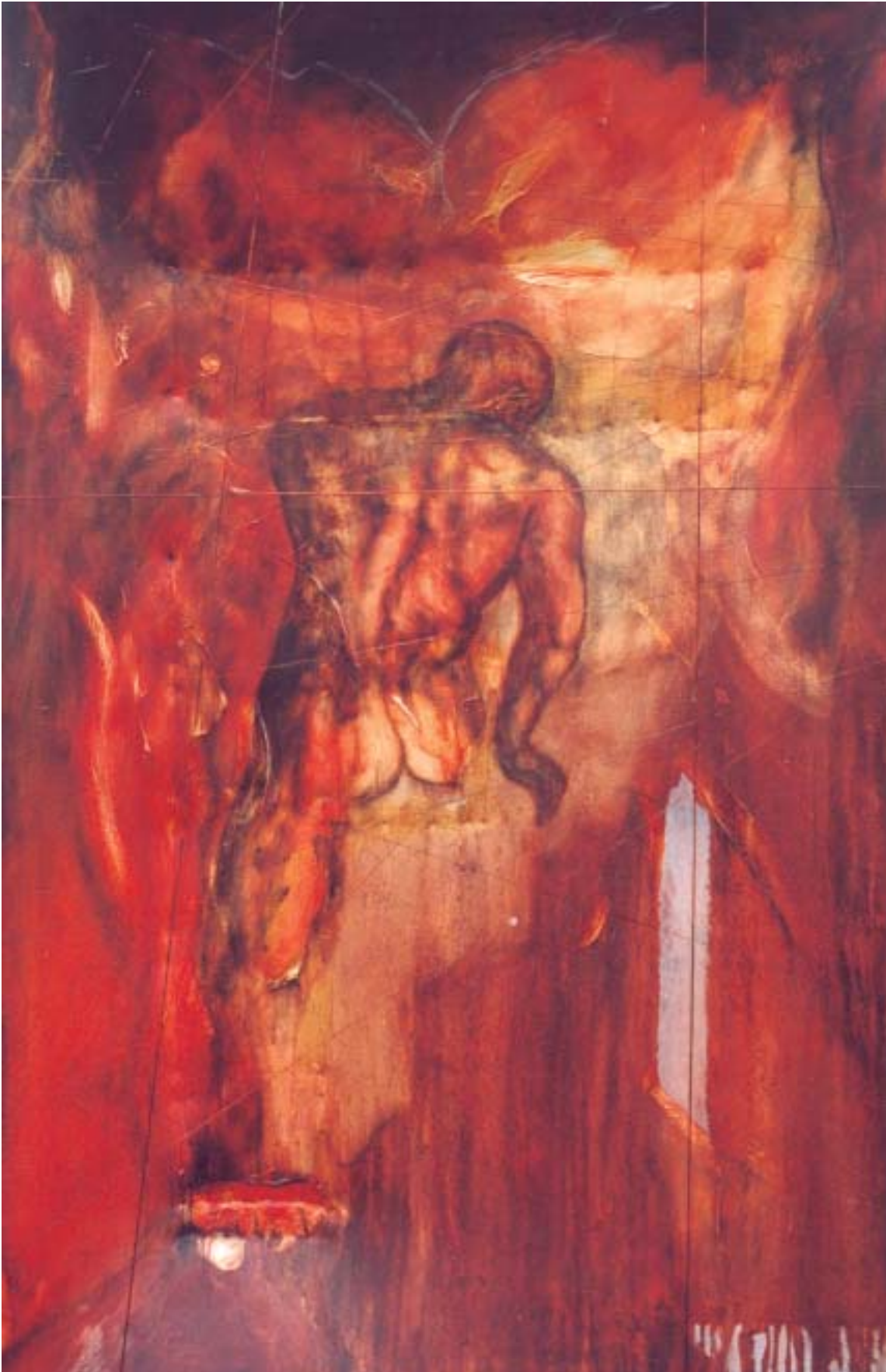
L'ange déchu , 2002, techniques mixtes sur toile, 152 x 102 cm