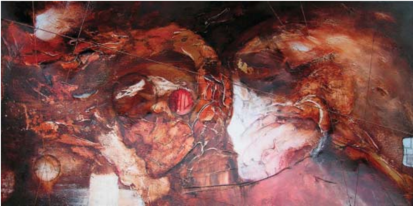
Papillon blanc , 2003, techniques mixtes sur toile, 51 x 102 cm

Everything has to be reinvented, because the way we see ourselves and our environment is always in transformation, from one culture to another, from one period of life to another. Samson has come up with his own solution, conceiving what he calls 'des enfoncés' – canvasses mounted on false frames which are much deeper than normal, and which he uses to create a highly tangible sense of depth or 'relief.'