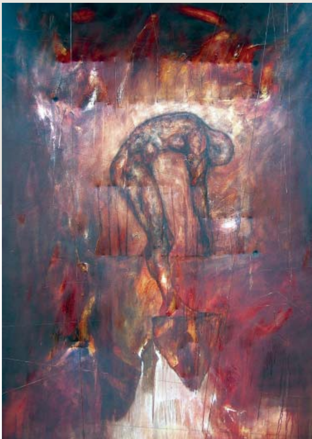
Last life , 2002, techniques mixtes sur toile, 213 x 153 cm