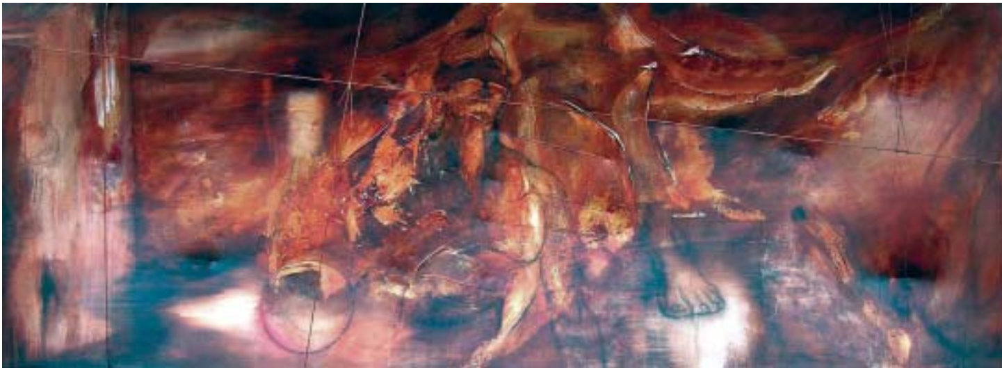
Jour de poisson , 2003, techniques mixtes sur toile, 61 x 173 cm

His palette is as lively as fire, as if he painted with lava. The textures moving across his surfaces are generous and expressive. Difficult to discern a particular theme on first viewing, perhaps because there really isn't one... unless it is the subject itself.