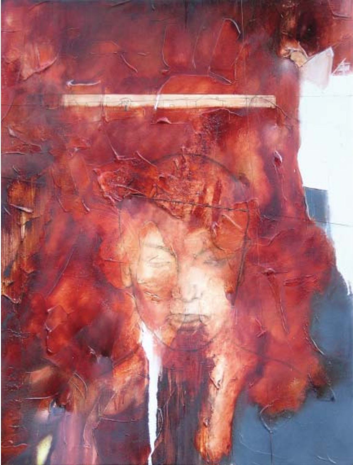
L'enfant roi , 2003, techniques mixtes sur toile, 122 x 91 cm