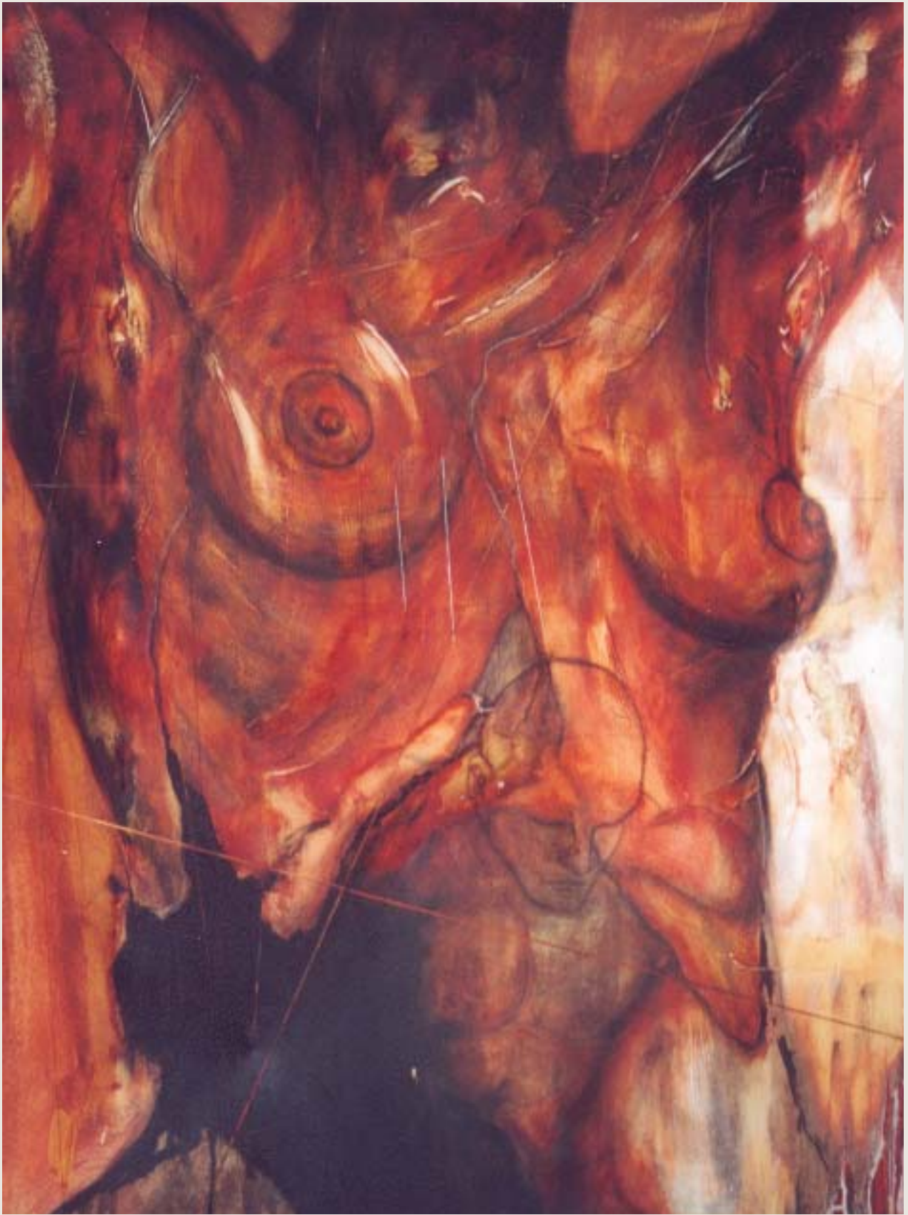
Sous l'écorce , 2002, techniques mixtes sur toile, 91,5 x 122 cm