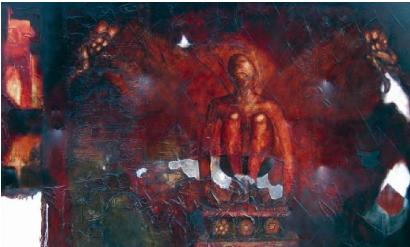
L'âme Papilionaire , 2003, techniques mixtes sur toile, 165 x 285 cm

Il a conçu ce qu'il appelle des enfoncés. Il s'agit d'une toile montée sur un faux cadre beaucoup plus profond qu'à l'habitude et dans lequel il crée un relief par l'intérieur, donnant ainsi l'impression — bien tangible — de la profondeur.